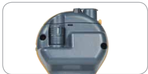
Der Quikstick ST POL78751 ist standardmäßig im Lieferumfang aller MMS2-Kits enthalten und bietet die gleiche Leistung wie der standardmäßige Quikstick. Ein Quikstick ST kann während der Verwendung der Stifte am MMS2 angeschlossen bleiben.

Messwerte von mehreren Hygrosticks können durchgeführt und problemlos aufgezeichnet werden. Feuchtemesswerte können entweder mit Hülsen oder Feuchtekästen durchgeführt werden. Für diesen Test sollten keine Humisticks sondern Hygrosticks verwendet werden.