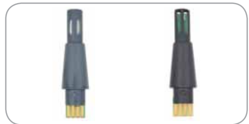
Der Hygrostick, Artikelnummer POL4750, ist für Anwendungen mit hoher Feuchte geeignet.