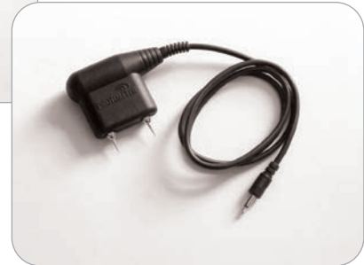
BLD5060 „Heavy Duty“-2-Stiftesonde