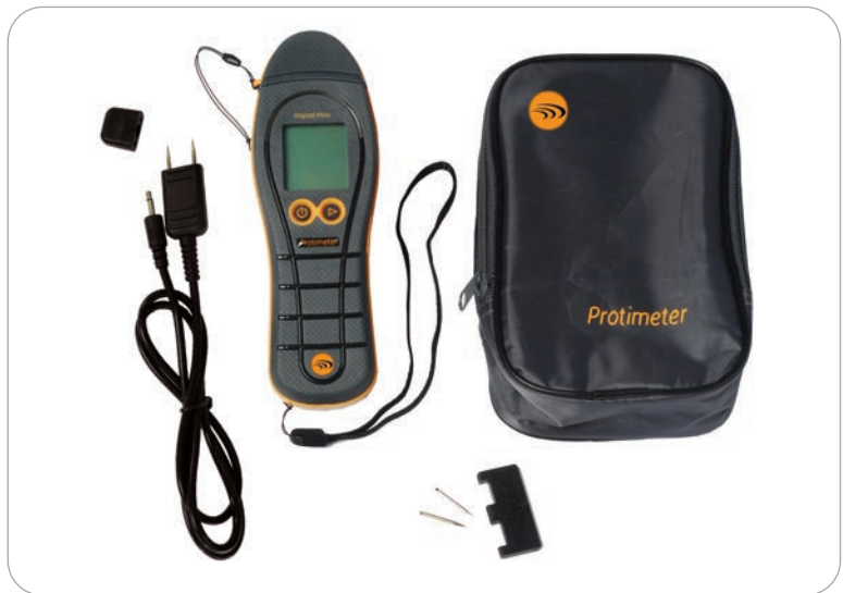
BLD5702 - Digital Mini Standard-Kit